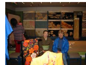
⑦ Kimono shop

Much of the Edo atmosphere has been left behind