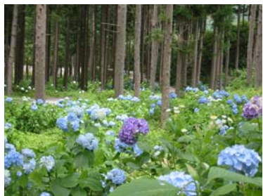
② Walking path