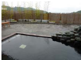
⑤ Onsen, or Hot spring