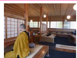
④ Zazen, or Meditation

30 minutes from Ueda station via the Bessho line