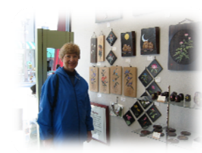
⑧ Wood carving craft shop