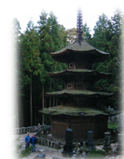
③ Anrakuji-Temple National Treasure