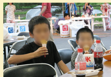
↑アイスやかき氷をおいしくいただく子どもたち

ステージの発表や食べ物コーナーや遊びのコーナーにくぎ付け。学校は夏休みに入ったばかりで解放感に溢れるなか早速、夏のお祭りを満喫することができました。ご招待ありがとうございました。