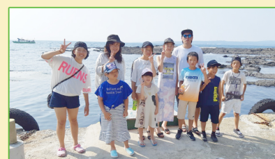
↑ユニットの子どもが全員揃いました！

たかずやの里には5つのユニットがあり、一つのユニットに最大8人の子どもが生活しています。ひまわりユニットは、小学生から高校生までの児童が生活する男女混合ユニットです。とても賑やかな毎日を送っています。学校の部活や地域のスポーツクラブに入っていて、帰って来ても庭でサッカーをやったりキャッチボールをしたり熱心です。夏休みには毎年一泊二日でユニット旅行を計画しますが、今年は和倉温泉まで行ってきました。初めての海という子どももいて、とても嬉しそうに遊んでいたのが印象的でした。みんなで楽しく過ごせて良かったです。