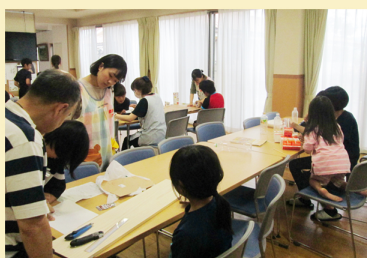
↑職員と夏休み工作に取り組む子どもたち

困ったときには他の人の知恵を借りながら、子どもと職員とが一緒に制作でき、楽しい工作教室になりました。