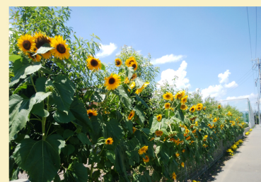
↑綺麗に咲き誇る大輪のひまわり

今年は、敷地内に花を植えたいとお話したところ、ご家庭から花苗を持ち寄って、あちこちに植えていただきました。ひまわりは青空に向かって大輪の花を咲かせました。色とりどりの花が子どもたちの情緒を育てくれます。