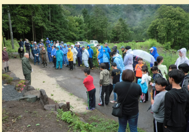
↑作業前のあいさつの様子

富島のふれあいの森は、5年前まで、たかずやの里があった場所です。今は広葉樹の苗木が植えられ、キャンプなど野外活動ができるよう、かまどや水道施設も用意しています。本年も6月15日午前8時から梅雨空の下、富県全地域から40名余の皆さんとたかずやの子どもたちや法人役員、職員も加わり、敷地内の草刈り作業を行いました。生憎の雨のため予定していたバーベキューはできませんでしたが、皆様の協力で短時間できれいになりました。