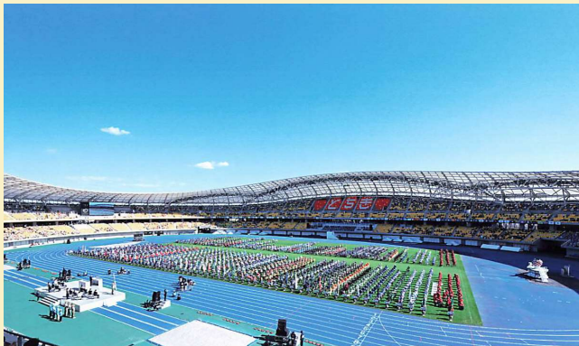
いちご一会とちぎ大会 第22回全国障害者スポーツ大会

練習を何度か重ね大会に臨み、目標とする60mを超え3位に入賞しました。この大会を通じ、身体共に成長する良い機会が持てました。