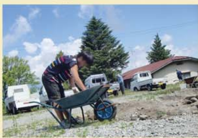
介 かまど作りでは石を運ぶのも重労働でしたが中高生を中心に根気よく頑張っていました。

旧施設跡地の「ふれあいの森」周辺の環境整備作業を6月16日に行いました。富県地区社協の皆様、たかずやの里の児童と職員の総勢65名が協力して汗を流しました。昨年植樹した苗木の手入れ、石を利用したかまど作り、草刈り、暖炉に使う薪運びなどを行いました。伸びていた雑草が刈られ、見違えるように綺麗になりました。早朝より富県地区の皆様にお集まりいただき、心から感謝しております。今年の夏は、さっそくかまどを使って調理をしました。地域の皆様も是非ご利用ください。