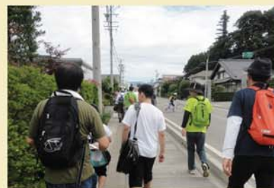
介 暑さに負けず、景色の変化を楽しみながらリュックを背負って歩きます。

東春近地域で毎年実施されている『東春近ハイキング』が6月24日にあり、たかずやの里の小学生から中学生の5名が参加しました。天候にも恵まれ、澄み切った青空のもと、東春近周辺の道をみんなで歩きました。地域の人たちと一緒に会話を楽しみながら、途中で虫を捕まえたり、休憩場所の三峰川公園では参加していた同級生たちと一緒に遊具で遊んだり…。暑さが厳しい天候ではありませんでしたが、新緑の美しい季節の中、子どもたちは元気いっぱい歩くことができ、とても楽しいハイキングとなりました。