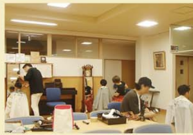
介 3名の美容師さんがカットに来てくれました。さっぱりすると、子どもたちも大満足です！

たかずやの里では、多くの方々からご支援・ご協力をいただいています。『n-west(駒ヶ根市)』の皆様には毎年4回ほど、たかずやの里まで足を運んでいただき、子どもたちの髪のカットをしていただいています。毎回20名ほどの子どもたちがカットを希望し、短い時間の中ではありますが子どもたちと楽しく会話しながら、可愛く、そしてかっこよく、髪をカットしてもらっています。ちょっぴり緊張しながら、鏡を見つめて椅子にじっと座る子どもたち…(笑)それも良い経験ですね！