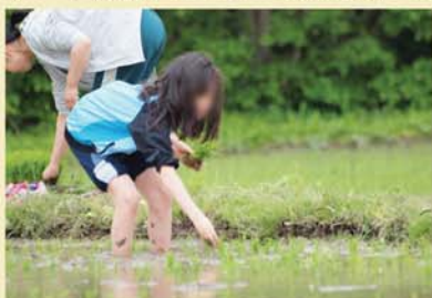
介 泥んこになりながら手作業で植えました。また秋にみんなで収穫できるのが楽しみです。

毎年田んぼをお借りしている方に協力していたが、今年も5月13日に無事田植えを行う事が出来ました。少しふざけていた小学生に対して、1人の高校生が「しっかりやれよ。自分たちで食べる米なんだからさ。」と伝えている姿がありました。小学生は学校でも田植えはしますが、中高生はなかなかやる機会がないなかで、『自分たちで食べるお米』という意識でやっていると思うと、みんなで田植えをやる意味がまた一つ増えたと感じることが出来ました。また一ついい経験ができた嬉しくなりました。