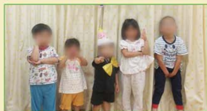
介 誕生日会のあとにみんなでポーズ★主役は大きな帽子と蝶ネクタイでキメていますね！

たかずやの里には5つのユニットがあり、一つのユニットに最大8人の子どもが生活しています。たんぽぽユニットは、未満児から年長までの子どもが生活しています。屋内ではおままごとやヒーローごっこで、屋外ではボールを蹴ったり砂場で泥遊びをしたりと、いつも男女関係なく仲良く遊んでいます。一番好きなのは歌うことです。保育園で覚えた歌、好きなアニメの歌、テレビで流れていた歌などをいつでも歌っています。うる覚えな歌も多いので、歌詞はオリジナルになることも…？いつも元気な歌声が聞こえてきます。