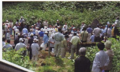
住民参加の源水視察

小学校の総合学習と連携していると共に用水路散策・歩く会、源水視察など地域コミュニティの醸成に努めている。