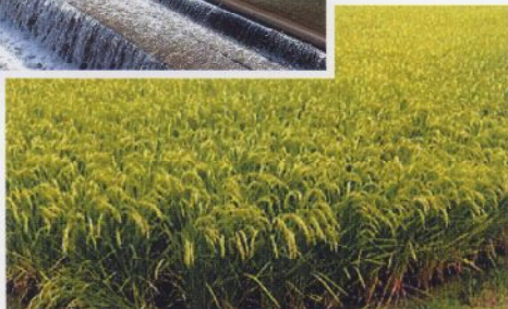
五郎兵衛米の実る水田