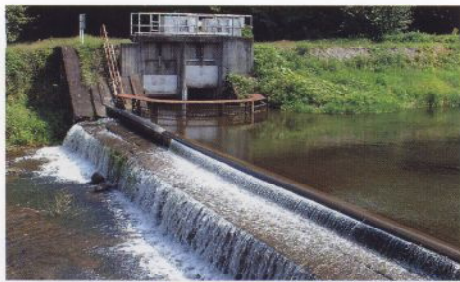
頭首工 鹿曲川より取水