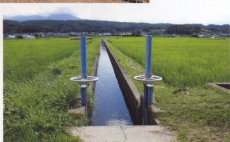
五郎兵衛用水と蓼科山を望む