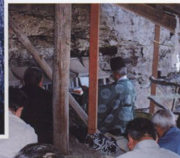
水神祭 旧掘貫の上鎮座の水神社