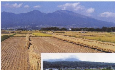
五郎兵衛新田と 浅間山を望む